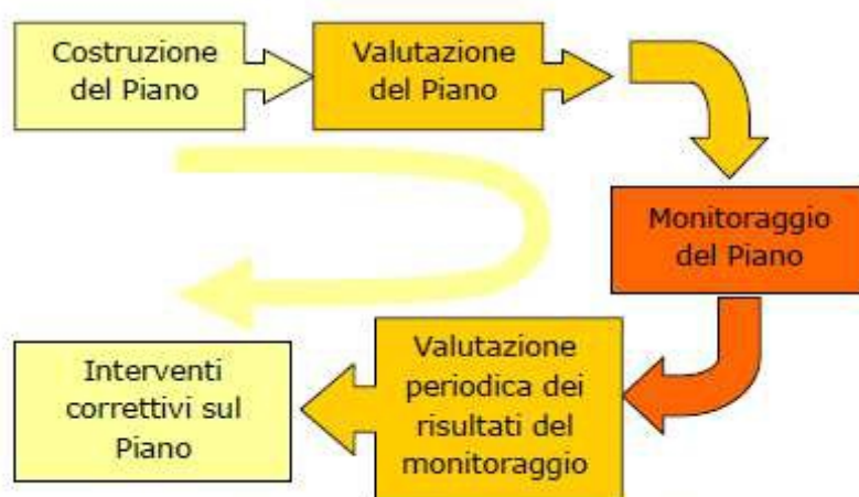
Processo circolare: azioni di feed-back susseguenti il monitoraggio

L'articolo 10 della Direttiva 2001/42/CE stabilisce che "Gli stati membri controllano gli effetti ambientali significativi dell'attuazione dei piani e dei programmi al fine, tra l'altro, di individuare tempestivamente gli effetti negativi imprevisti ed essere in grado di adottare le misure correttive che ritengono opportune". Il controllo degli effetti ambientali significativi connessi con l'attuazione di un piano e programma avviene attraverso la definizione del sistema di